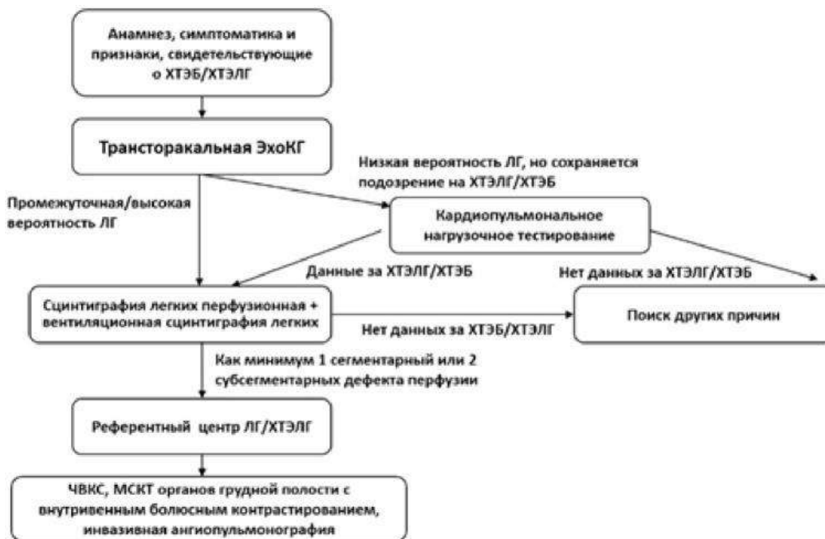
Таблица 18. Выполнение стандарта обследования в зависимости от уровня медицинского учреждения

Рисунок 3. Алгоритм обследования больного с подозрением на хроническую тромбоэмболическую легочную гипертензию и хроническую тромбоэмболическую болезнь (адаптировано из Wilkens H, et al., 2018) [33]